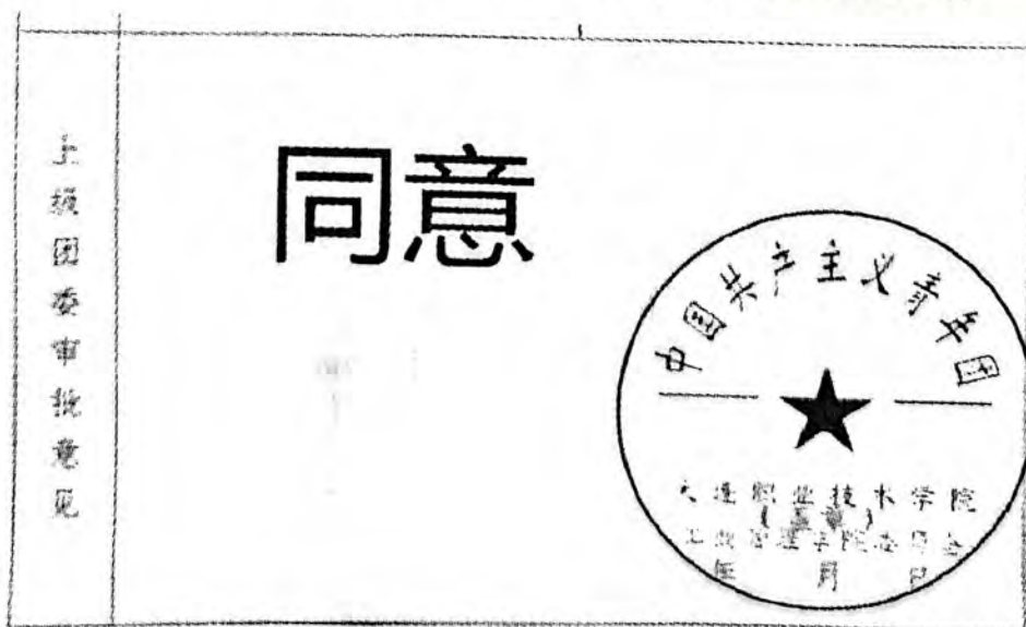
图9 上级团委审批意见和盖章均经过图片软件处理（辽宁大连职业技术学院工商管理学院）