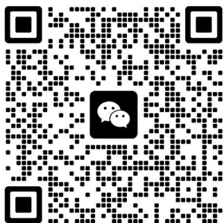
（学院推荐学员微信群聊）

2. 请学院推荐学员加入下方微信群（群聊二维码附下），待入学考核结束后，将移出入学考核未通过学员；请报名自荐的学员加入 QQ 群：1102292322，自荐遴选有关消息将通过此群发布。入群需注明学院、姓名、职务等信息。